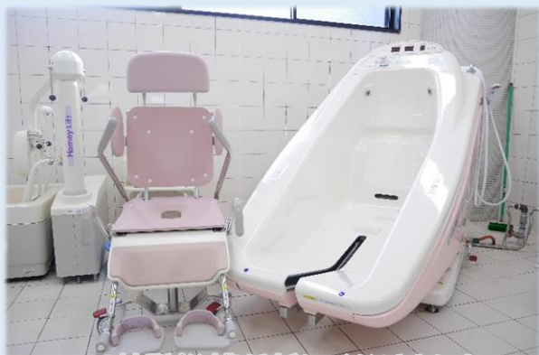
「特殊浴槽が新しくなりました」