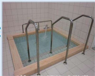
「松の香り漂う大浴場」