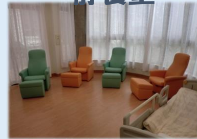
「昼食後 休憩にもどうぞ」