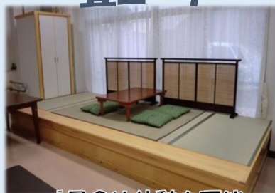
「昼食や休憩も可能」